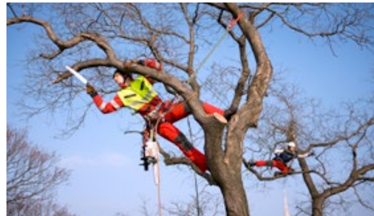
Totholz wird regelmäßig von BaumpflegerInnen entfernt.

Bei der Baumkontrolle werden das Umfeld, der Standraum und der Baum selbst auf Verkehrssicherheit geprüft, Maßnahmen vergeben und im Baumkataster dokumentiert.