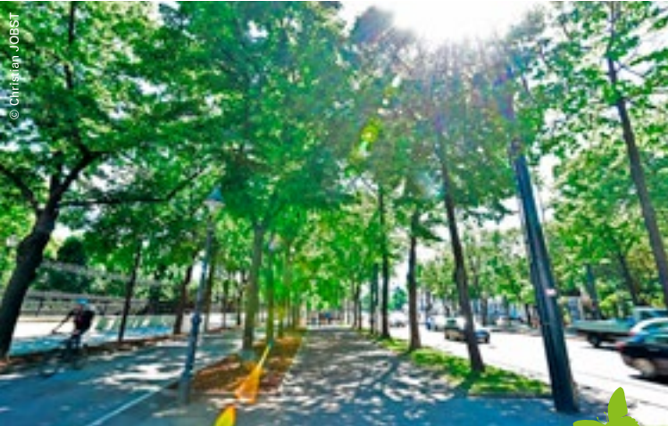
2.000 Bäume säumen die Wiener Ringstraße.