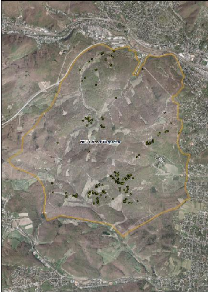
Abb. 2: Entwicklungsbäume von Cerambyx cerdo , kartiert 2017. Der Johannser Kogel blieb heuer unberücksichtigt.