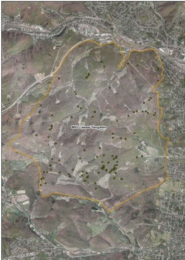
Abb. 1: Rosalia alpina im LTG 2017. Der Johannser Kogel wurde heuer nicht untersucht.